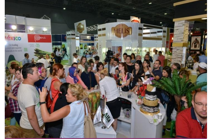
Gıda Dünyasının Türkiye Buluşması

INGREDIENTS – Özel Gıda Katkı Maddeleri Bölümü